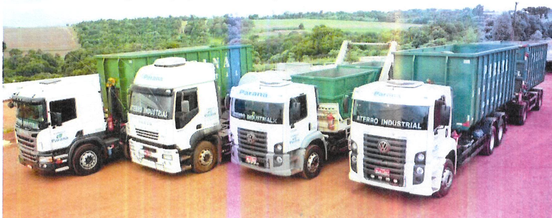
Imagem n.º 01 – Alguns equipamentos disponíveis

5 Condição de Pagamento: Conforme edital de contratação.