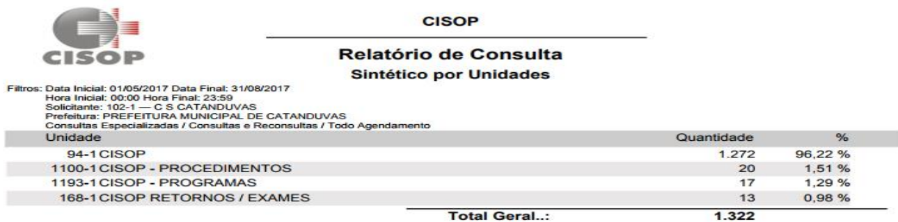
Relatório de Consulta Sintético - por Unidade de saúde